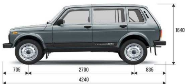
LADA 4X4 LONG